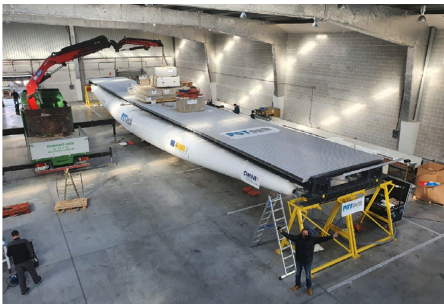
Prototipo de puente de estructura hinchable.

El segundo grupo, con cuatro propuestas aprobadas, incluye temas de desarrollo y aplicación de herramientas y modelos avanzados de cálculo y predicción. Uno de los programas se interrumpió al desistir el doctorando por motivos personales. Los tres restantes son también historias de éxito y su aportación a las empresas participantes fue muy valorada. La investigación llevada a cabo se reflejó en artículos en revistas de prestigio, tal como se espera de los doctorados puramente académicos.